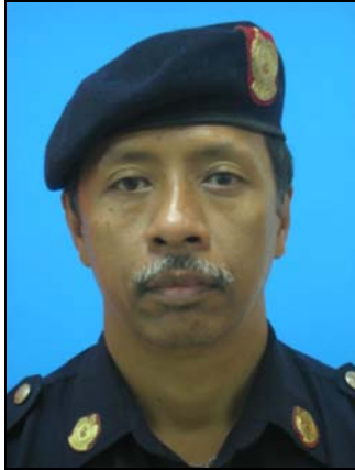
ABDUL SAMAD BIN A HAMID